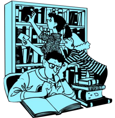
Centros de documentación