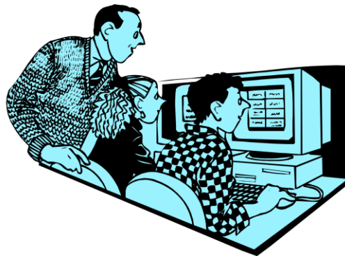
Institutos de investigación